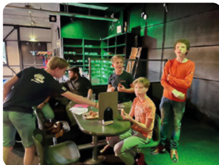
De eerste avond van de 12+groep. Een leuk groep jeugd bij elkaar. Op naar een mooi seizoen met de jeugd!