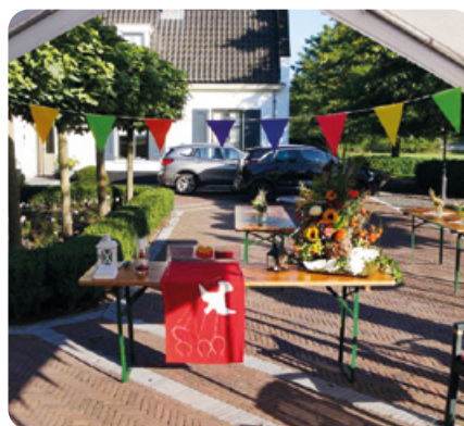
'Kerkzaal' startzondag 15 september

Mooi en passend was de herbevestiging van diaken Roland Fennema.