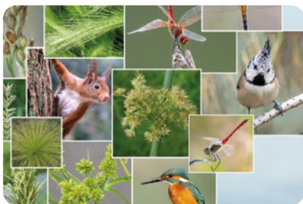
Deel paneel 'Biodiversiteit in Amersfoort'

De tentoonstelling 'Biodiversiteit in Amersfoort' bestond uit een kleurrijk half rond paneel met foto's van herkenbare flora en fauna, vier informatiepanelen, een plek om liefdesbrieven te schrijven (of een tekening te maken) aan de aarde en spelletjes voor jong en oud.